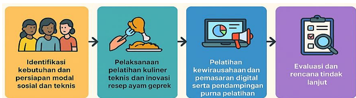
Gambar 1. Tahapan Pelaksanaan Pengabdian

Tahap terakhir adalah evaluasi dan rencana tindak lanjut, yang bertujuan mengukur dampak pelatihan pada pendapatan ibu rumah tangga, keterampilan kuliner, dan jejaring usaha. Evaluasi dilakukan melalui metode kombinasi kuasi-eksperimental ( pre-test dan post-test pendapatan, keterampilan, pemasaran) serta wawancara mendalam dan refleksi kelompok, sesuai pendekatan umum dalam studi pengabdian (Poerwarini et al., 2023) dan (Megavitry et al., 2024). Hasil evaluasi digunakan untuk merencanakan tindak lanjut seperti pembentukan kelompok usaha bersama atau koperasi kuliner lokal, serta penyusunan modul pelatihan yang dapat direplikasi di desa wisata lain. Melalui pendekatan partisipatif dan evaluatif ini, pengabdian diharapkan berdampak berkelanjutan dan sistemik dalam pemberdayaan ekonomi perempuan di Kampung Warna-Warni.